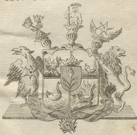
Grev BRANDTS Vaaben.