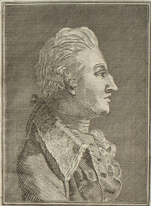
Greve ENEVOLD BRANDT Directeur for den Franske Skue= plads og Maitre des plaisirs.