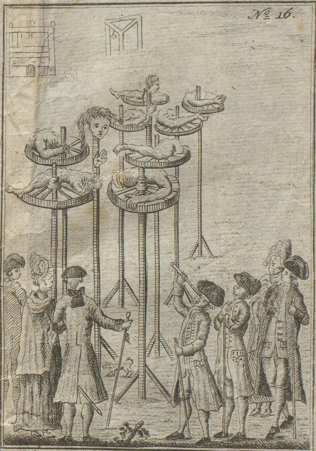
Forrige Grev IOHAN FRID. STRUENSEE, og Grev ENEVOLD BRANDT, forrestillet og afbildet po hiul og Steyler, d. 28 April 1772.