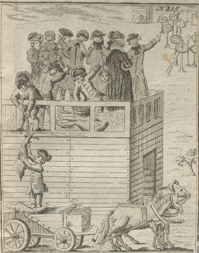
Afbildning paa Henrettelsen af de tvende Grever STRUENSEE og BRANDT, d. 28 Apr. 1772.

O'et uheldigt Syn af Aadsler og af Kroppe! Som nyelig hugede til ærens høje Toppe Hvo Gud for Øye har, og er sin Konge troe Harey al frygte for at Doe som disse toe.