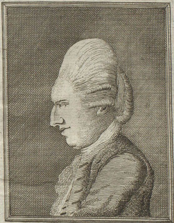
Greve IOHAN FRIDER. STRUENSEE. Kongelig Danske Geheime = Kabinets = Minister.