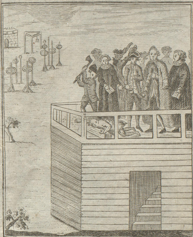
Afbildning paa Henrettelsen af de tvende Grever STRUENSEE og BRANDT, den 28 April 1772:

Her sees Exempel paa, hvad Løn den falske ære Til sidst medfører dem, som Udyds Slaver ere Her sældes Hovmod ned fra ærens høje Top Iust da den tænkte best at svinge sig derop.